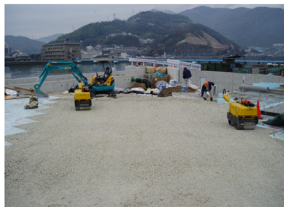
▲スーパーソル施工完了