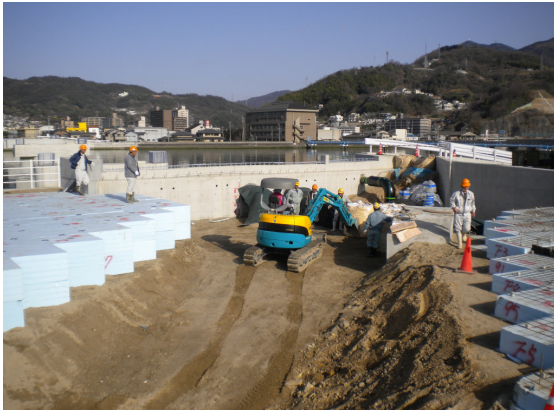
▲スーパーソル施工前