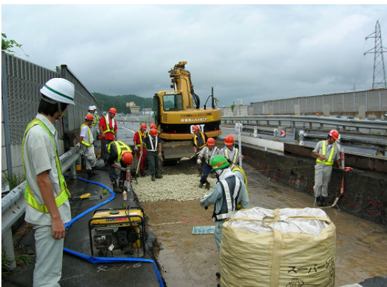
▲スーパーソル投入