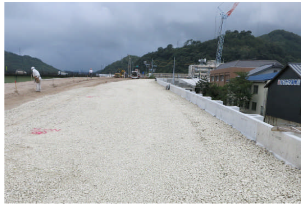
▲スーパーソル施工完了