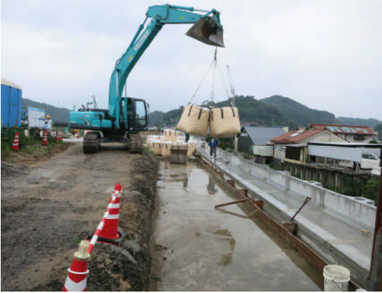
▲スーパーソル施工前