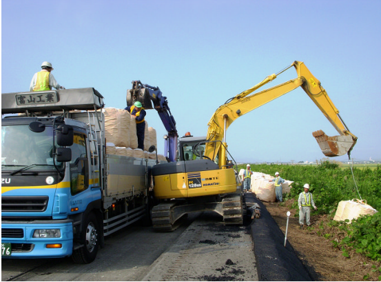
▲スーパーソル搬入