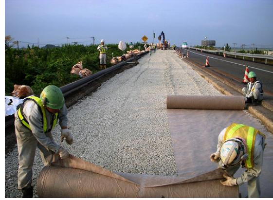
▲土木透水シート敷設