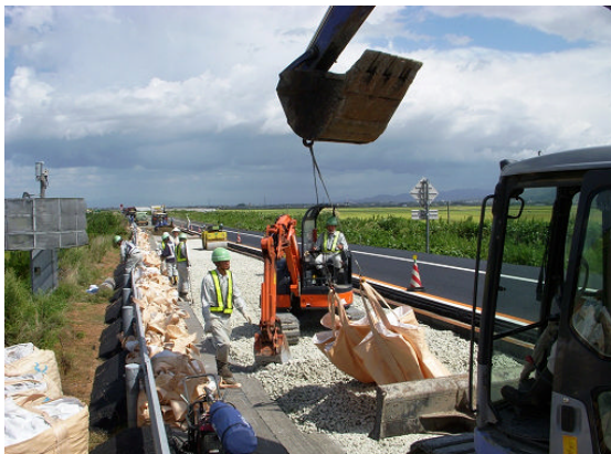
▲二層目スーパーソル投入