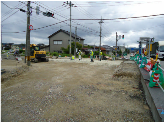
▲スーパーソル投入前