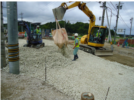
▲スーパーソル投入 (2層目)