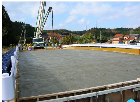
▲軽量コンクリート打設