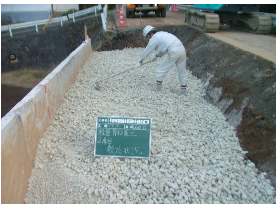
▲スーパーソール敷均し