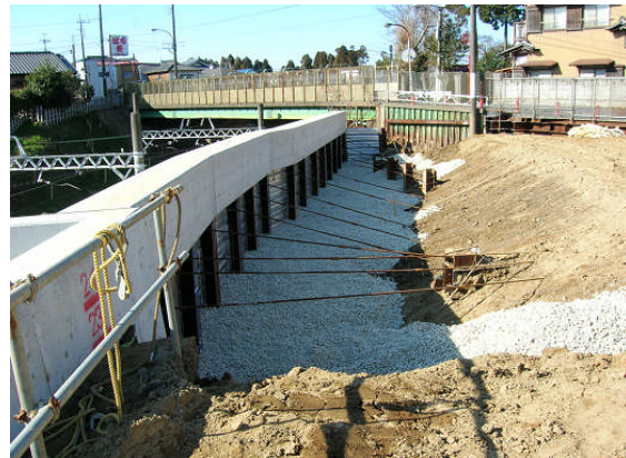
▲スーパーソル投入②