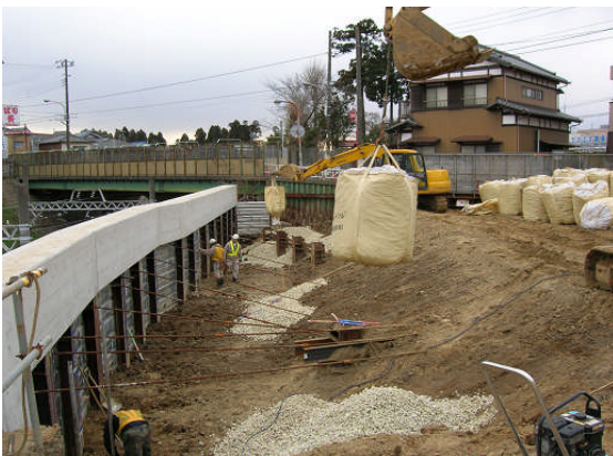
▲スーパーソル投入①