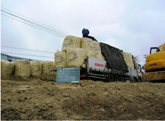
▲スーパーソル搬入