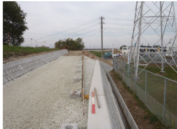
▲スーパースोल施工完了