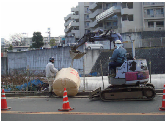
▲投入（道路反対側より）