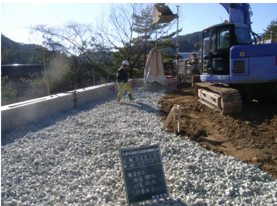
▲投入・敷均し (15層目)