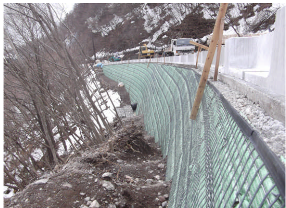
▲スーパースォル施工完了