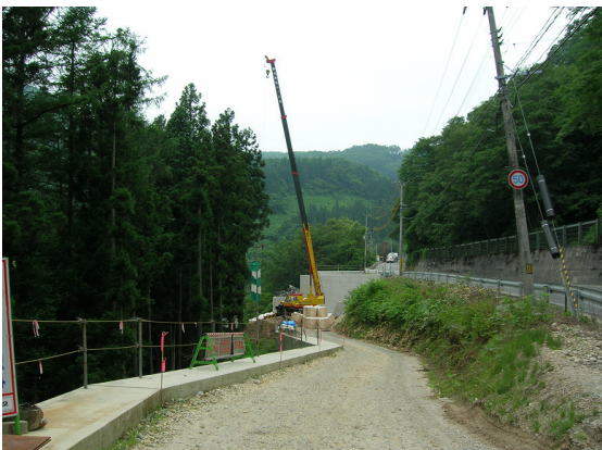
▲スーパーソル搬入