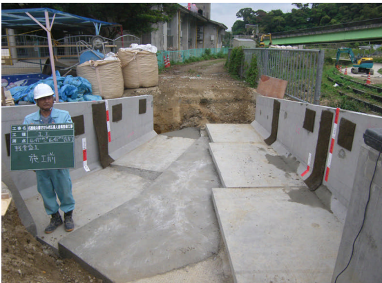
▲スーパーソル施工前