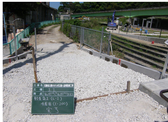
▲スーパーソル敷設完了