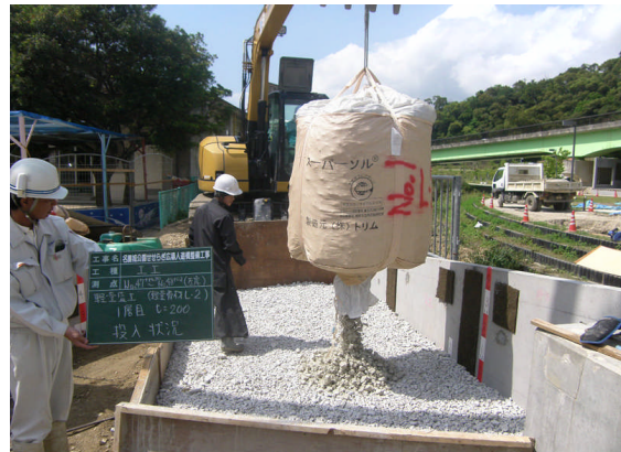
▲スーパーソル・L2投入