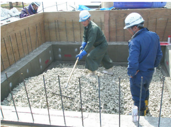
▲スーパーソル敷均し