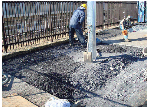
▲砕石の上から転圧