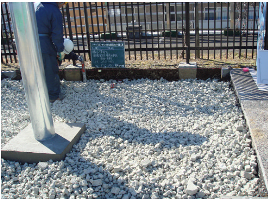
▲スーパースォル敷き均し後