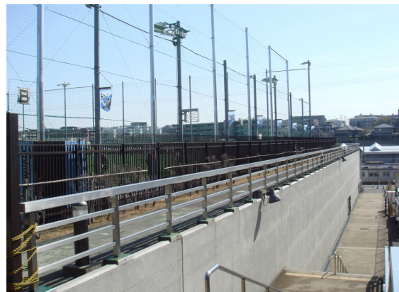
▲配水施設屋上防球ネット設置完了