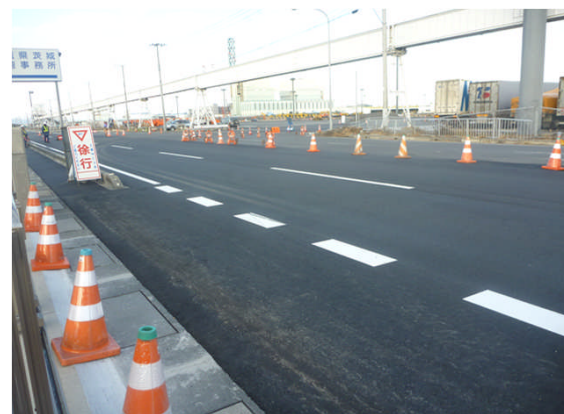
▲スーパーソル施工完了