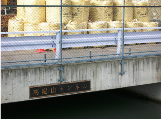
▲スーパーソル納入