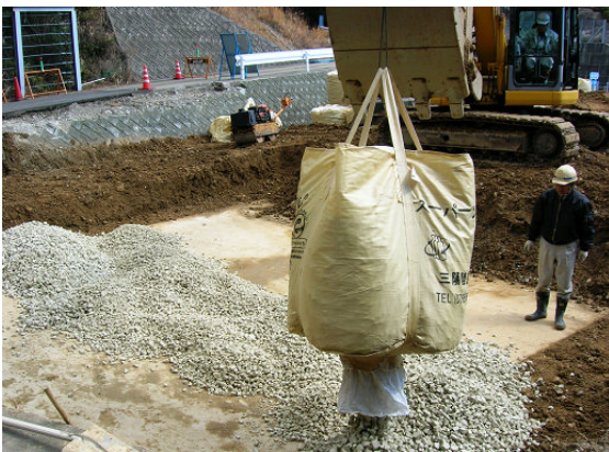
▲スーパーソル投入