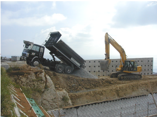
▲スーパーソル投入