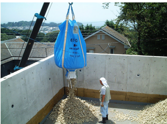
▲車庫上部の投入状況①