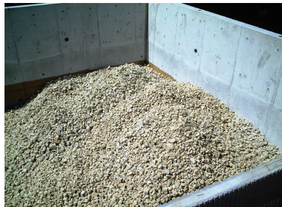
▲車庫上部の投入状況②