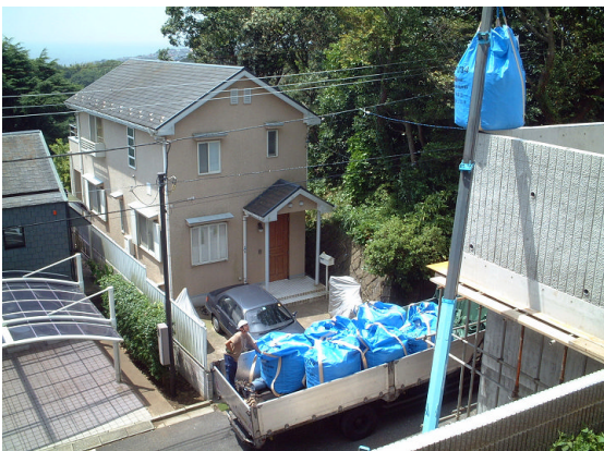
▲スーパーソル投入