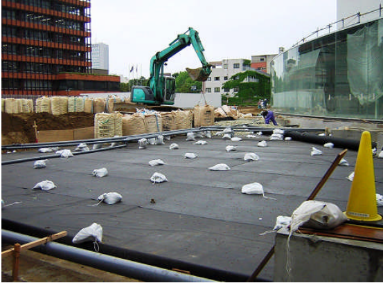
▲スーパーソル搬入