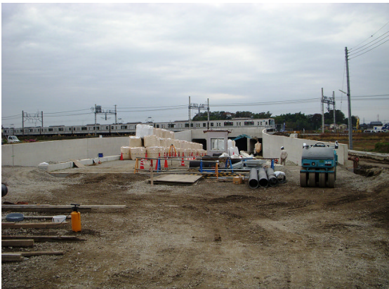
▲スーパーソル投入①