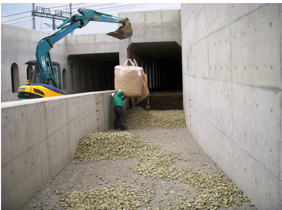
▲スーパーソル投入②