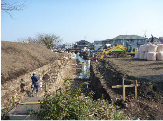
▲スーパーソル施工前