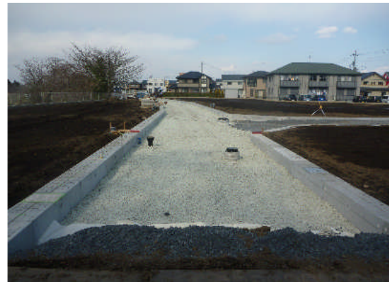
▲スーパーソル施工完了