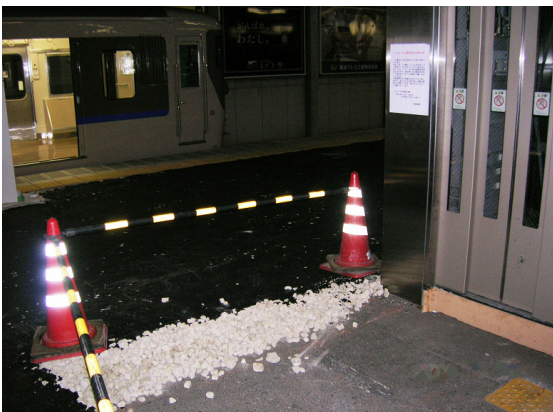
▲直接アスファルト舗装①