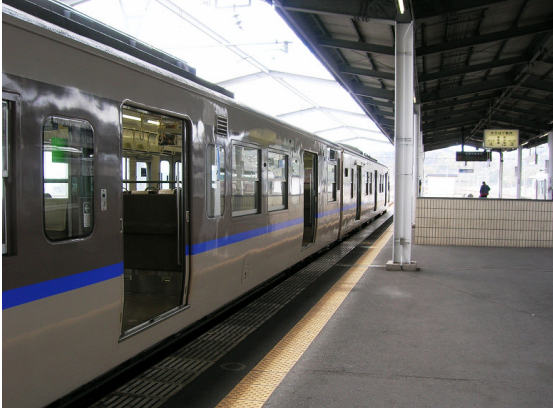
▲車両床とプラットホームの段差