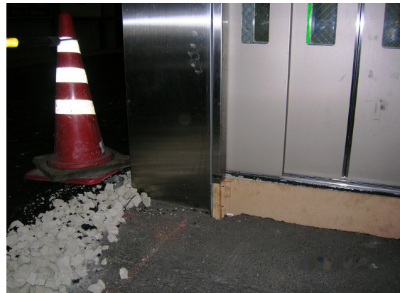
▲直接アスファルト舗装②