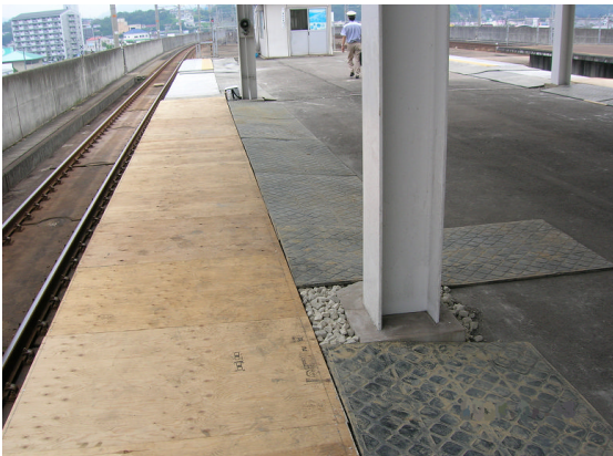
▲スーパーソル敷き均し