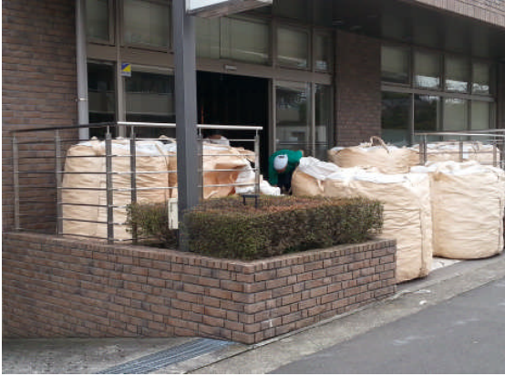
▲スーパーソル搬入