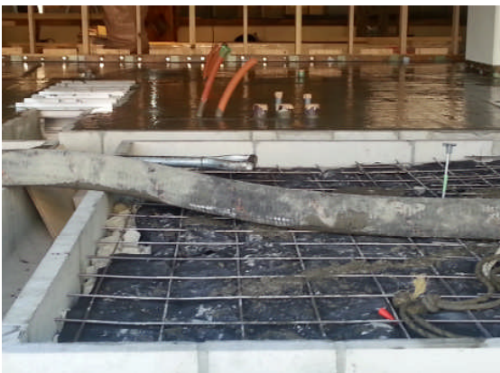
▲ワイヤーメッシュ