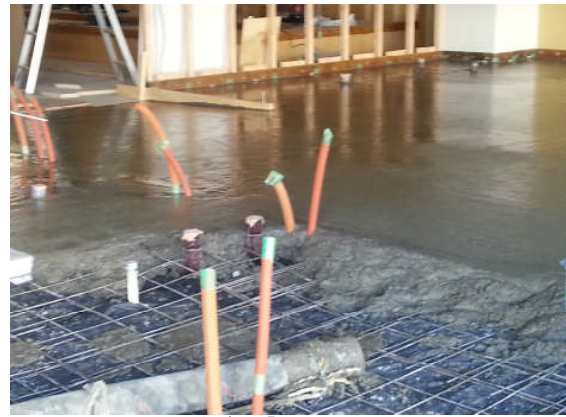
▲コンクリート打設