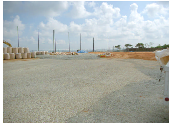
▲スーパーソル敷詰め