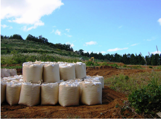
▲スーパーソル搬入