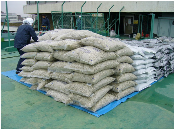
▲50ℓポリ袋入りのスーパーソル搬入