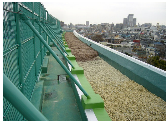
▲土投入・敷き均し