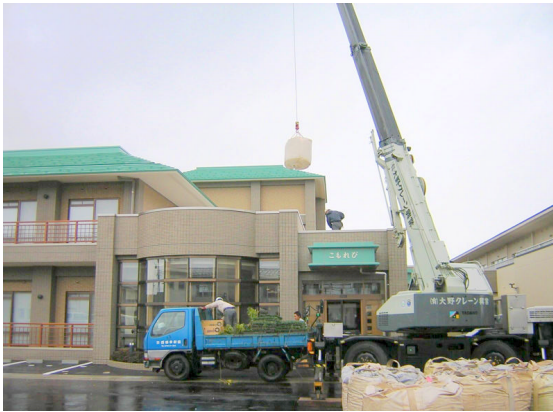
▲スーパーソル搬入