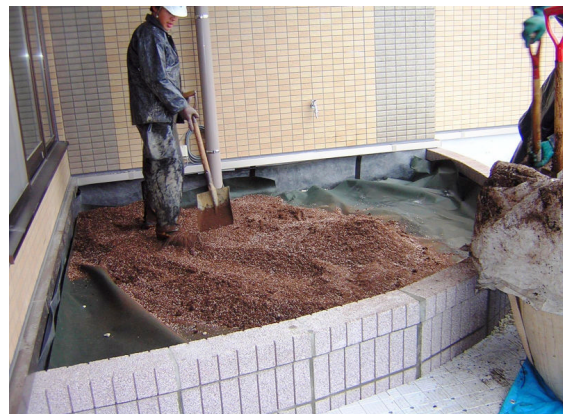
▲土木透水シート敷設・混合土投入