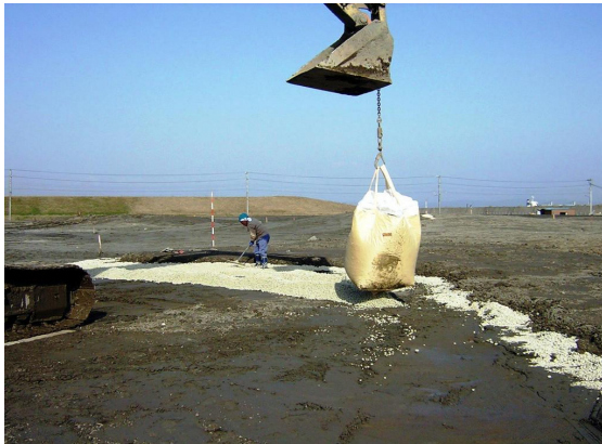
▲スーパーソル投入