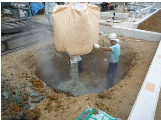
▲スーパーソル投入