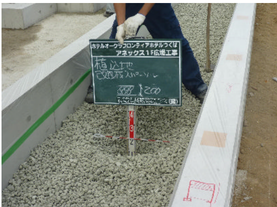
▲排水基盤材敷き込み