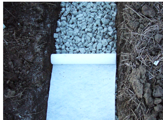
▲透水シートの敷設