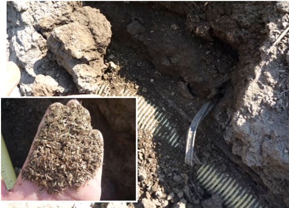
▲既設暗渠管（疎水材としてもみから使用）