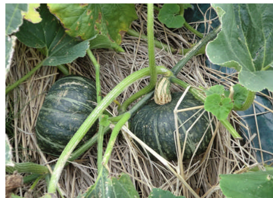
▲施工翌年の生育状況