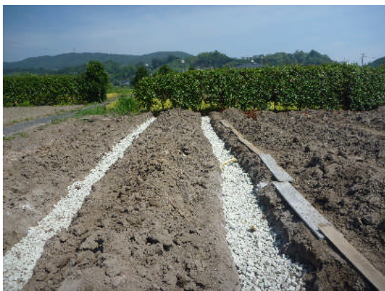
▲スーパーソル敷設