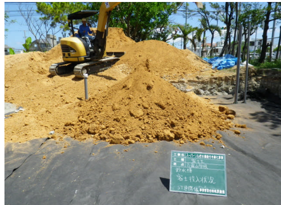
▲透水シート敷設後、客土投入