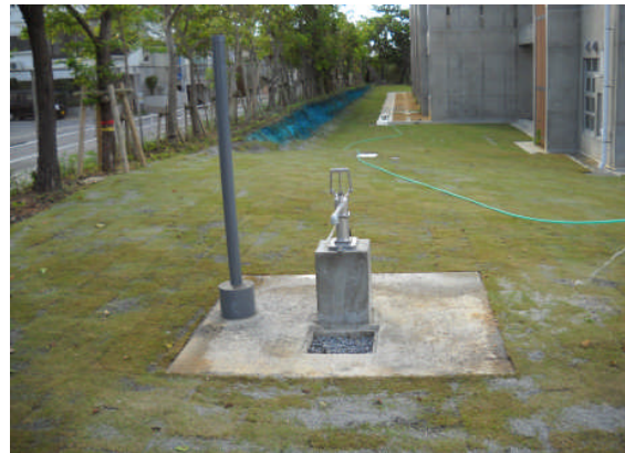
▲施工完了（手漕ぎポンプと水位計）