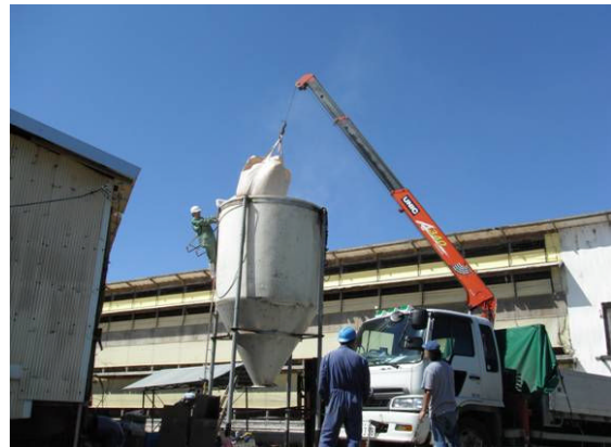
▲スーパーソル投入