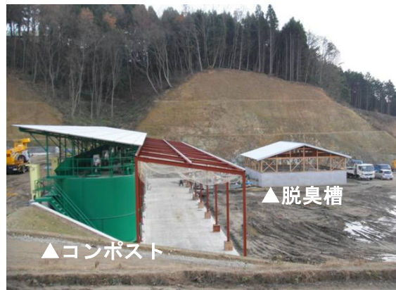
▲コンポスト・脱臭槽完成