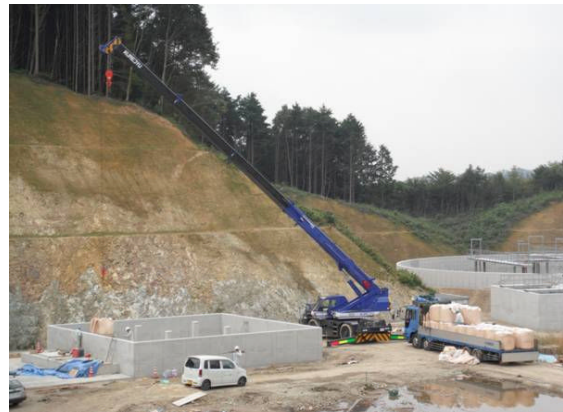
▲脱臭槽へスーパーソル投入